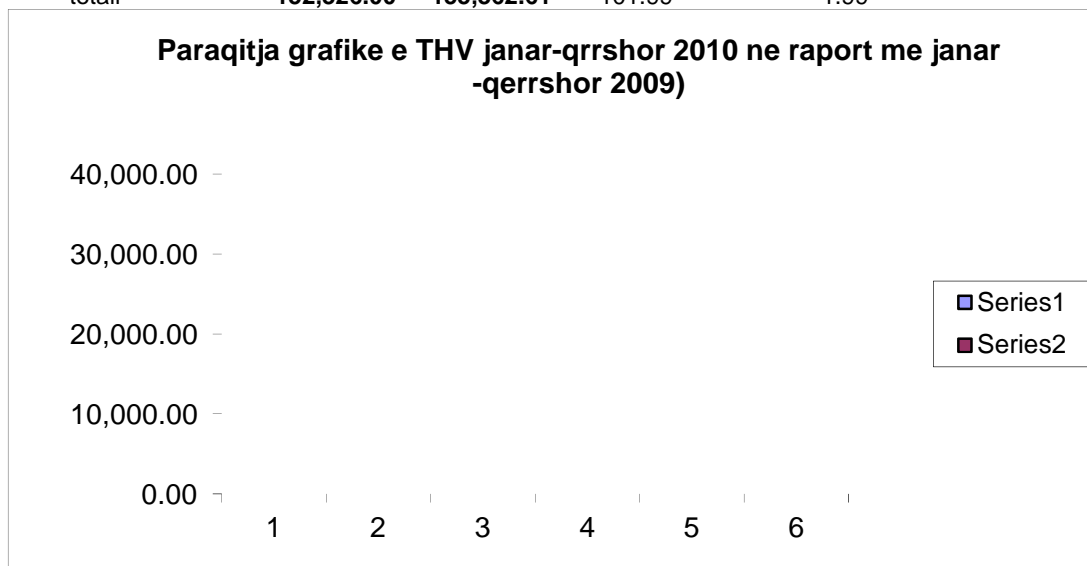
Paraqitja grafike e THV janar-qrrshor 2010 ne raport me janar -qerrshor 2009)