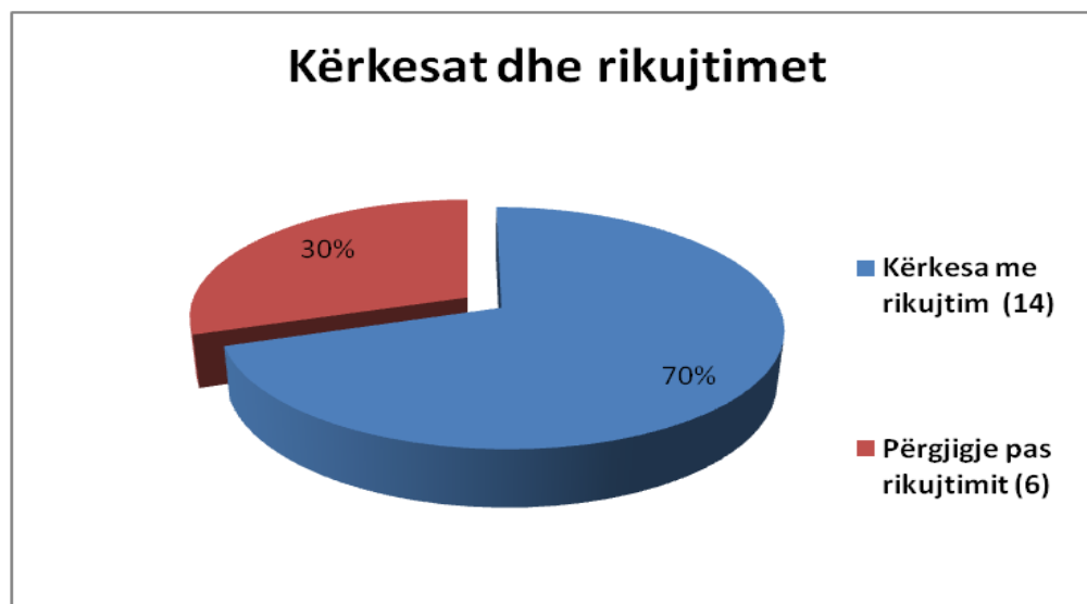
Grafika 2. Kërkesat e përsëritura